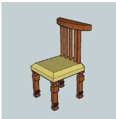
Gambar 4. Kursi yang dirancang

Adapun kursi yang dirancang terdapat pada Gambar 4.