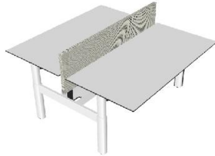
Gambar 5. Meja Kerja

Adapun gambar meja kerja dapat dilihat pada Gambar 5.