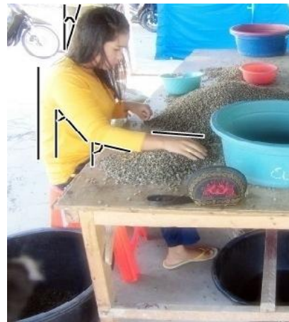
Gambar 3 Data Pengukuran Metode Rula Dengan Postur Kerja Menggunakan Alat Kerja

Sistem kerja dengan menggunakan alat kerja berupa kursi dan meja kerja dapat dilihat pada Gambar 3.