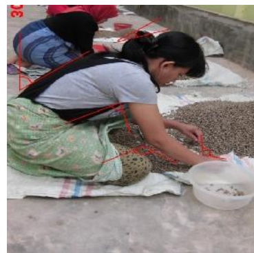
Gambar 2. Data Pengukuran Metode Rula Untuk Elemen Kegiatan Dengan Postur Bungkok

Dari data postur tubuh pekerja sortasi biji kopi, maka dapat dilihat hasil pada Gambar 2.